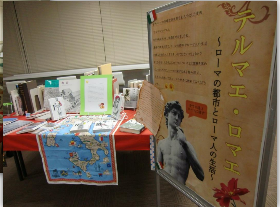
テルマエ・ロマエ展